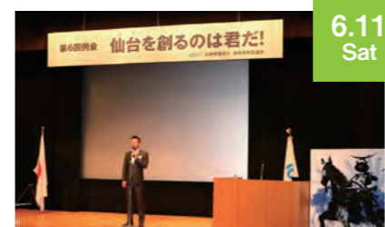
6.11 Sat 第6回公開例会

編集後記 本年度の仙台青年会議所は「未来を照らす光輝の輪を抜けよう!」をスローガンとし、活動を展開して参ります。震災を経て、これからの時代の仙台、宮城を築いていくために、皆が「丸」となり地域の光り輝く未来を思い描いていかねばならないと思っております。