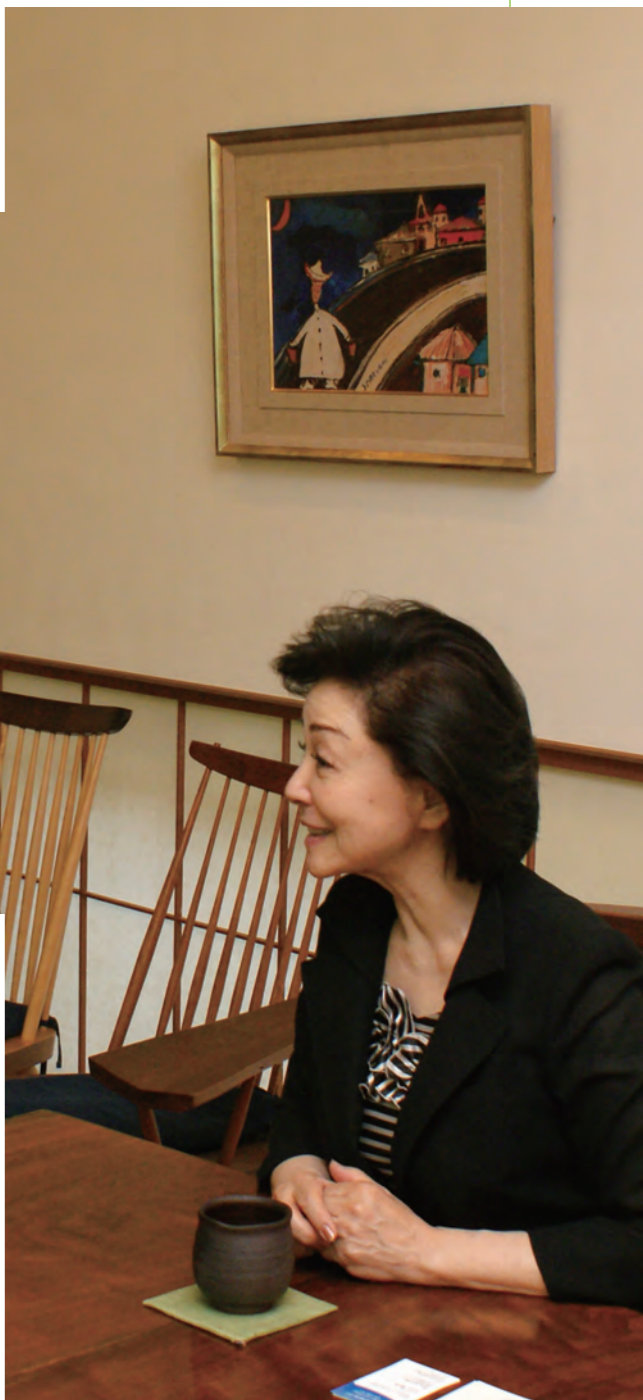
ジャーナリスト、国家基本問題研究所理事長 櫻井よしこ