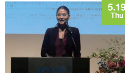
5.19 Thu 第5回例会

4月17日(日)11時~13時まで、藤崎本館アーケード内で、熊本地震支援金の募金活動を行ない、431,450円をお預かりしました。