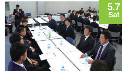
5.7 Sat 仮会員セミナーI開催

主催 JCI 公益社団法人仙台青年会議所 子どもの未来創造委員会 仙台市/仙台市教育委員会 仙台JC事務局 022-222-9788