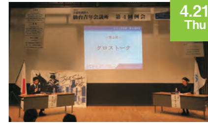
4.21 Thu 第4回例会