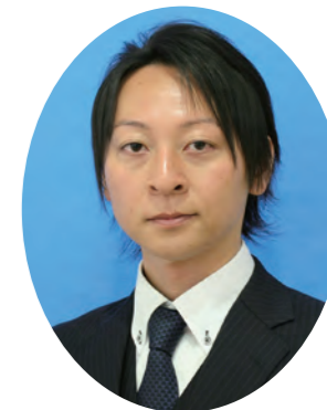
公益社団法人 仙台青年会議所 2016年度 七夕花火祭特別委員会 特別委員長