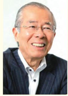
元松下政経塾塾頭 志ネットワーク代表 上甲 晃氏