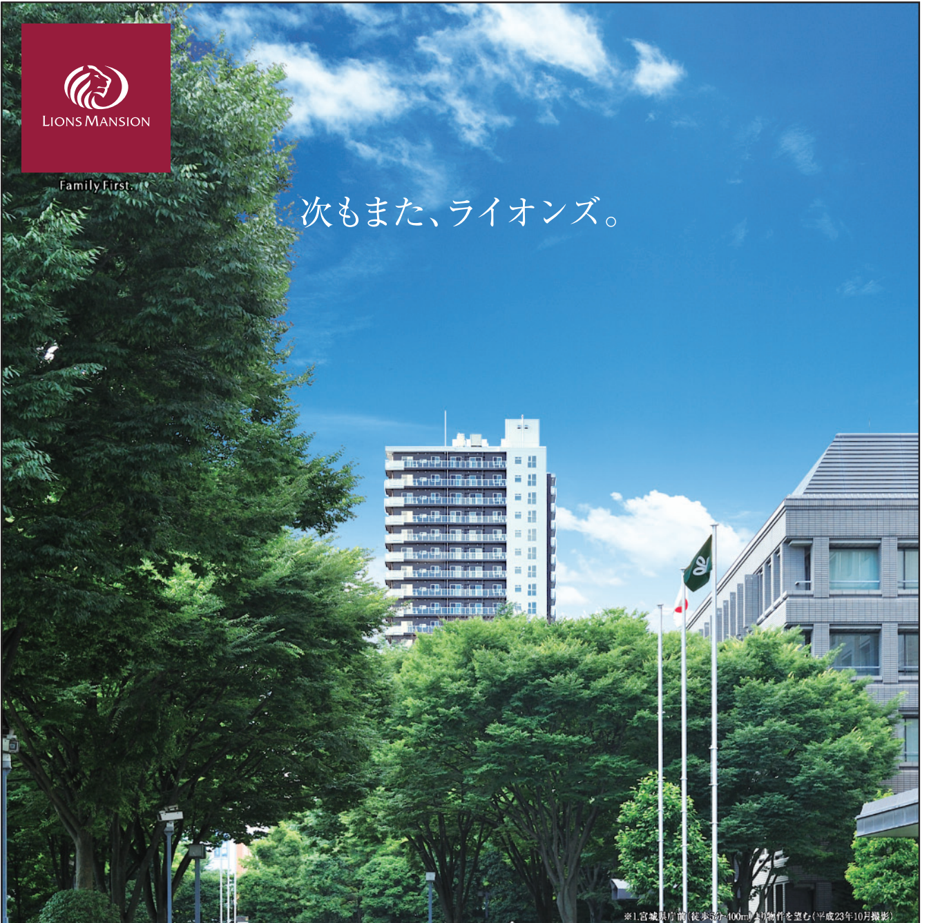
※1宮城県庁前(徒歩3分・400m)より物件を望む(平成23年10月撮影)