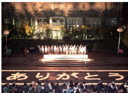
仙台市立八軒中学校吹奏楽部・合唱部の合唱