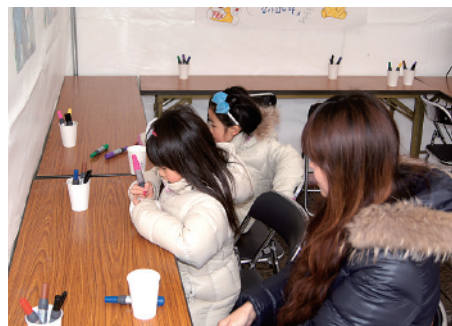
紙コップに感謝の想いをこめる子どもたち