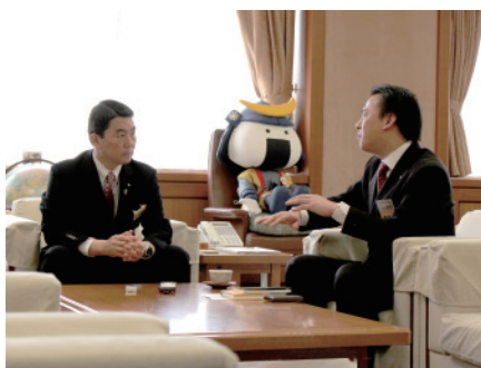
知事室での対談の様子

を引き継ぎ、安心して子どもを産み育てることができる社会を創っていくかなければならないということとです。税金を湯水の如く使って、行政が仕事を作っていくというのは一つの方法ですが、それは将来の人たちの負担を大きくしているだけだと思います。私は税金をなるべく使わないようにして、民間の活力で社会が構成され、産業が成り立つような宮城を作っていくと考えております。しかしながら、沿岸部は、そんなことをいっていられる状態ではありません。沿岸部の皆さんが自ら立ち上げられるところまで、我々が後押しする必要があります。そして、何とか生活できるレベルまでいったなら、自分たちの力で頑張っていた方がいい。これは、最優先で取り組まなければならないところです。 【茂】沿岸部は、震災前から高齢化が著しく進んだ地域で、震災を契機に、人口の流出が急激に進んでいます。その地域を根本から立て