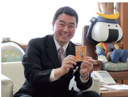
現在行われている事業、「感謝のストラップ」を手取る村井知事

5月から今年の事業として、仙台市民から感謝の想い詰め込んだストラップを作っていたアイデアです。その想いを全国のみならず海外の皆さまにも伝えるために、6月の香港アジア会議に集ったメンバーへ配布させていただきました。その際に村井知事の似顔絵ストラップがありましたので、受け取っていただけますでしょうか。 (笑)