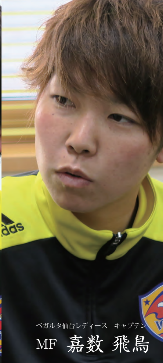
ベガルタ仙台レディース キャプテン