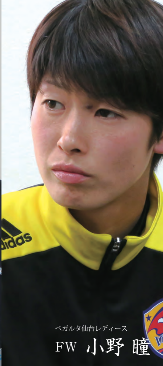
ベガルタ仙台レディース